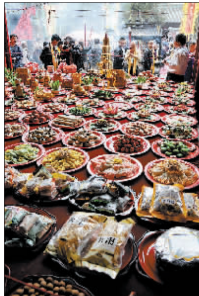
琳琅满目的祭祀用品。