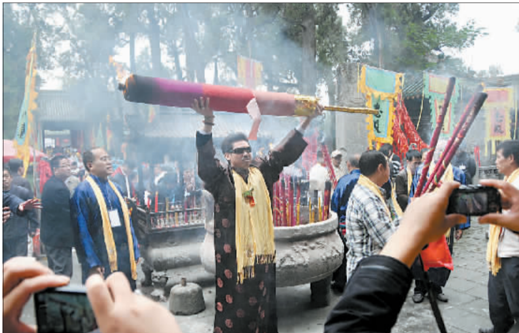
上香参拜。