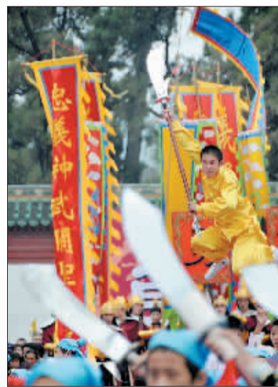
武术表演。