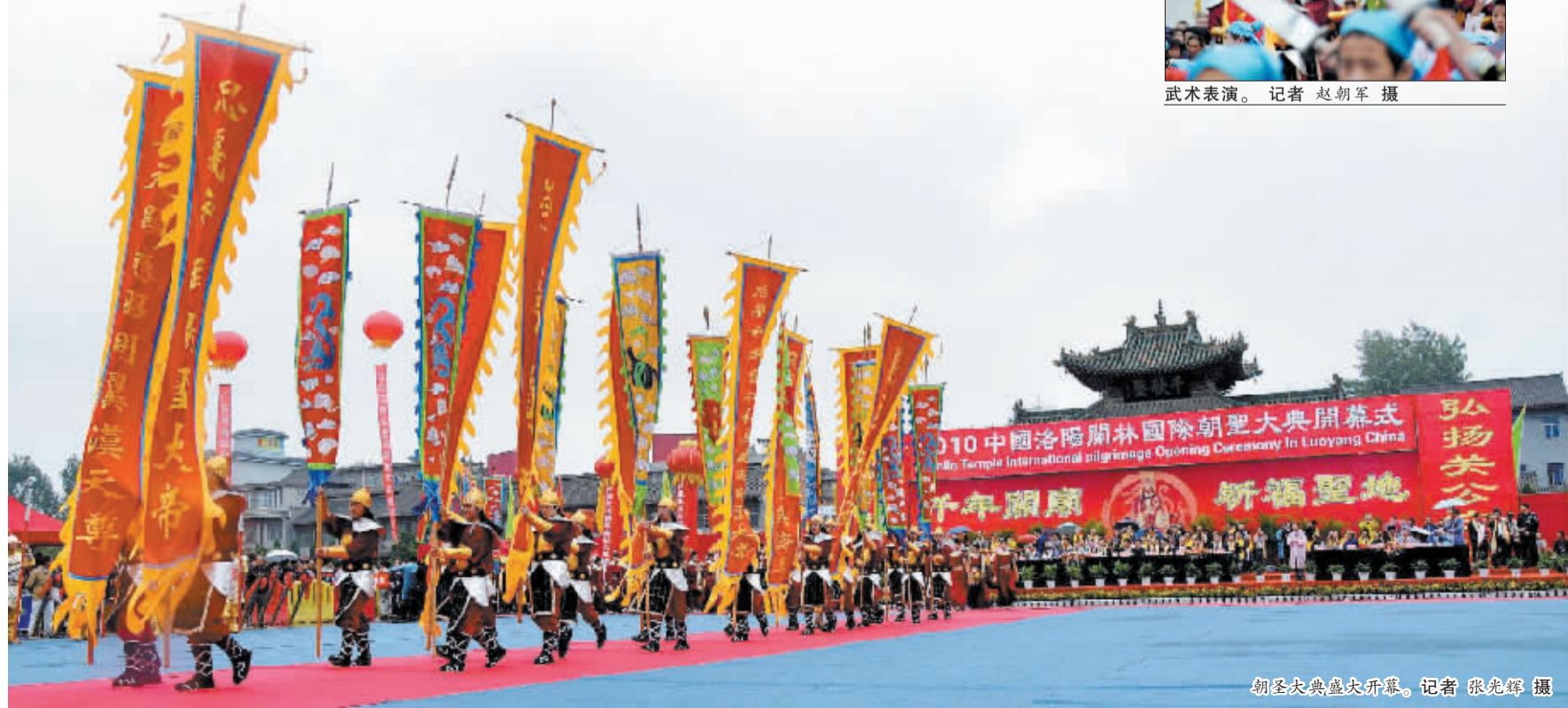
朝圣大典盛大开幕。

据介绍,本届关林国际朝圣大典由省文物局、洛阳市人民政府共同举办,与往届相比,参加今年关林国际朝圣大典的海内外朝拜团体和客商层次更高,范围更广,实力更强。为加强海峡两岸文化交流,结合今年9月至10月我省开展的“河南台湾文化月”活动,今年关林国际朝圣大典增加了海峡两岸关公文化论坛等活动。