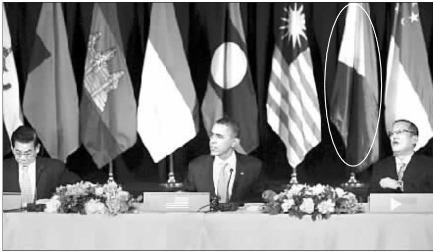
阿基诺(右)身后国旗倒挂了(圈中所示)。

菲律宾国旗旗面左侧为白色等边三角形,内有一个金色太阳和 3 颗黄色五角星;右侧由一个蓝色直角梯形和一个红色直角梯形组成。