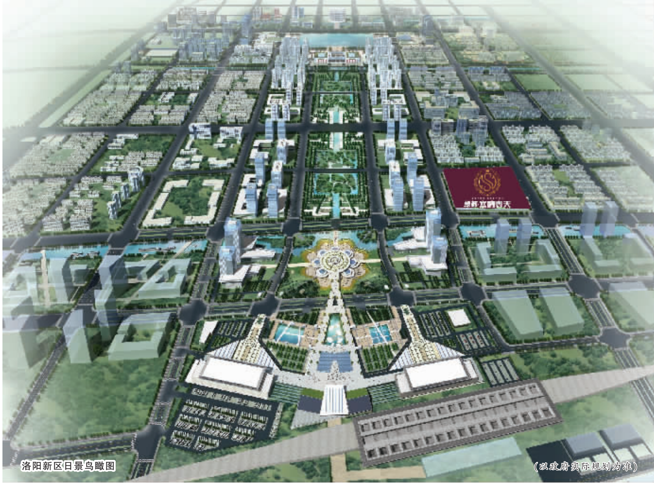
洛阳新区日景鸟瞰图

2010年2月,郑西高铁正式开通,这又为洛阳插上了腾飞的翅膀,它不仅拉近了城市之间的距离,更为城市高端商务圈的形成添