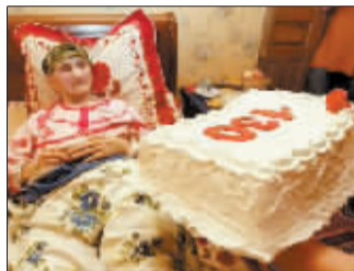
世界上年龄最大的人 (格鲁吉亚的 Antisa 130岁)