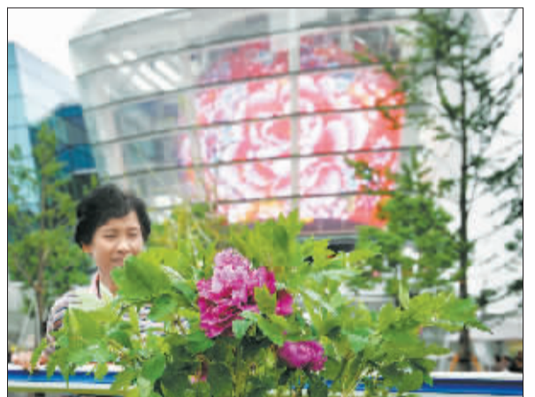
中国台湾馆前牡丹吐芳。