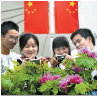
将世博牡丹的美丽定格。

虽然眼下上海是“一阵秋雨一阵凉”，但10月1日上海世博会中国国家馆日当天，中国馆前将呈现一派只有春天才有的景象：20多个品种的600盆洛阳世博牡丹将争奇斗艳，增彩中国馆日。