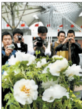
世博轴前牡丹绽放。