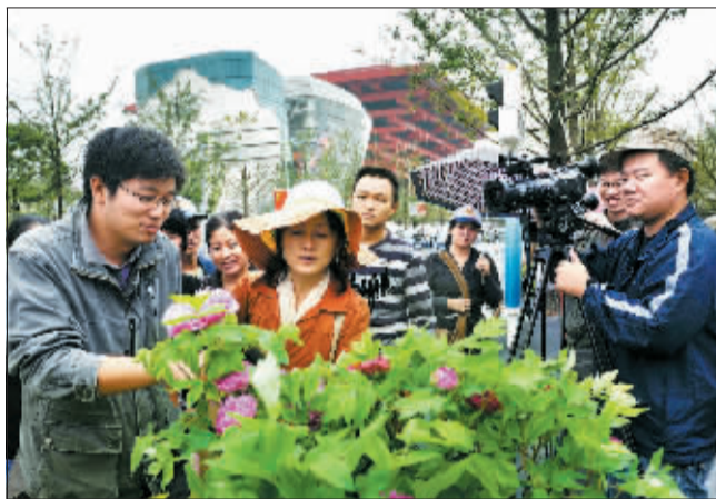
上海媒体记者聚焦世博牡丹。