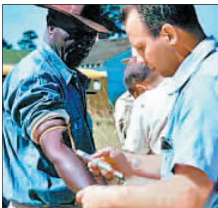
医生为患者注射试验药物,进行“塔斯基吉梅毒实验”。(资料照片)

我们感到愤慨。我们对发生的一切深表遗憾,向受这种可恶研究影响的每个人道歉。”希拉里9月30日晚已经与科洛姆通电话,代表她个人表达歉意。