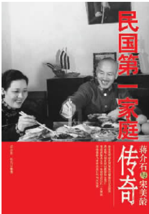
书名:《蒋介石与宋美龄:民国第一家庭传奇》 作者:师永刚 张凡 出版社:华文出版社

或许这是一代人的记忆。倘若顺着历史的长河逆流而上,我们还会看到更多的不同说法。1943 年的春天,罗斯福总统从中国召回两位对蒋介石最了解的美国人史迪威和陈纳德,想通过他们掌握的情况,制定一个战后的远东战略。陈纳德说,蒋是当时世界上最伟大的两三位领袖之一,史迪威则说蒋是“一条贪婪、固执和寡情的响尾蛇”,是“世界上最大的不学无术之人”。毛泽东也曾对蒋介石有过完全不同的评价。1938 年,当国共第二次合作进入蜜月期时,毛泽东说蒋是国民党历史上“伟大”的领袖。不过,当蒋介石掉转枪头之后,毛泽东的评价同样毫不客气。他在出版的 15 种毛泽东著作中,涉