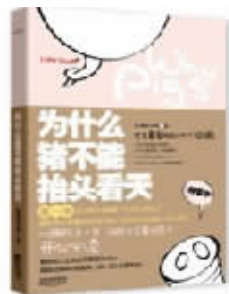
书名:为什么猪不能抬头看天 作者:熊猫翻书馆 推荐理由:成人“脱水加强版”十万个为什么,爆笑科学问答雷得你外焦里嫩且心服口服,彪悍的人生从此不需要问为什么。