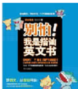
书名:别怕,我是搭讪英文书 作者:郑匡宇 推荐理由:我们都知道,不同场合要有不同的搭讪范儿。翻开本书,听搭讪教主娓娓道来,教你如何用英文融入不同场合。