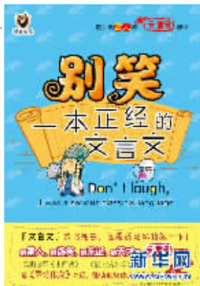
书名:别笑,一本正经的文言文 主编:童亮 推荐理由:此书告诉我们,古人绝对不是无趣致死的,而有可能是笑死的。这是一本正经的文言文,里面说的都是一些不正经的正经事儿。