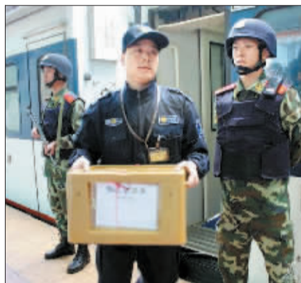
顺利押抵广州火车站。

16日10时19分,由上海驶往九龙的T99次列车缓缓驶入广州火车站。一号站台上,两辆运钞车严阵以待,广州亚组委工作人员忙碌着布置迎接现场,翘首以待“贵宾”的到来。