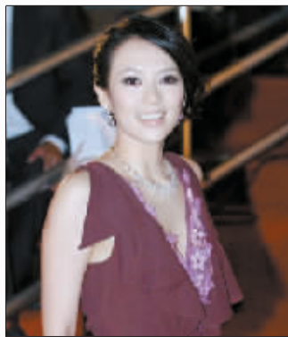
舒淇(上)刘晓庆(中)章子怡红毯竞艳。