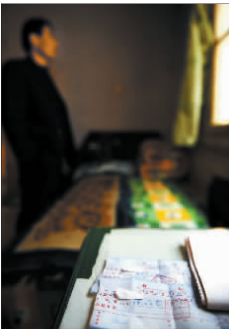
一名学生家长望着窗外,桌上摆放着学费收据。