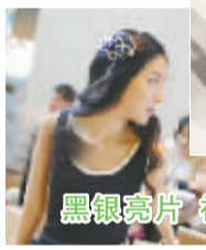
黑银亮片 神秘高贵

黑色和银色的亮片做成大片的树叶造型，中间宽，两边窄窄的收边恰似树叶尖尖的收尾，不但将刘海收起来，又能完美闪耀头发。