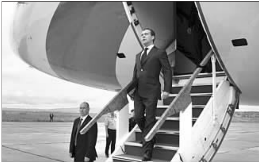
11月1日,梅德韦杰夫前往国后岛视察。(据中国日报网)

“在日本坚持北方四岛属于日本领土的立场下,(梅德韦杰夫)总统的访问让人非常遗憾。”菅直人1日在国会发表讲话说。据日本内阁官房长官仙谷由人透露,俄罗斯在梅德韦杰夫登岛前“未作正式通