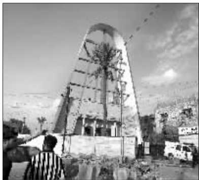
伊拉克安全部队在教堂外调查。

综合新华社、中国日报11月1日消息 “基地”组织伊拉克分支机构“伊拉克伊斯兰国”1日发表声明,宣称10月31日晚发生的巴格达教堂人质劫持事件是该组织所为。据伊内政部消息,这次事件造成包括人质、军警和武装分子在内共58人死亡,75人受伤。