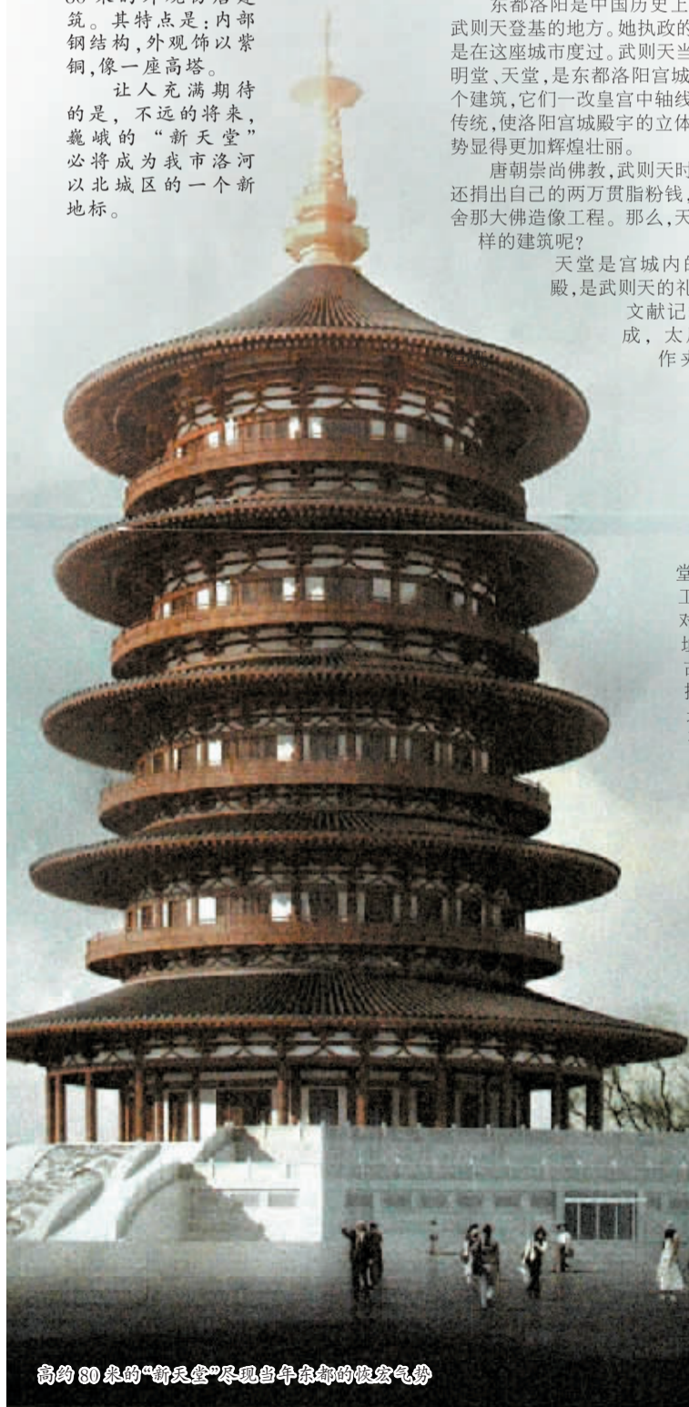
高约80米的“新天堂”尽显当年东都的恢宏气势

正因为如此,天堂的保护展示方案和明堂有着显著的不同。它是一个实实在在的建筑,力求恢复天堂原有建筑的外观,将成为隋唐洛阳城考古遗址公园的标志性建筑,成为洛阳大遗址保护的点睛之笔,成为现代化洛阳城中的新地标,成为洛阳文物保护的示范性工程。(敬请关注下篇:汉魏洛阳故城阊阖门二道门遗址保护展示工程)