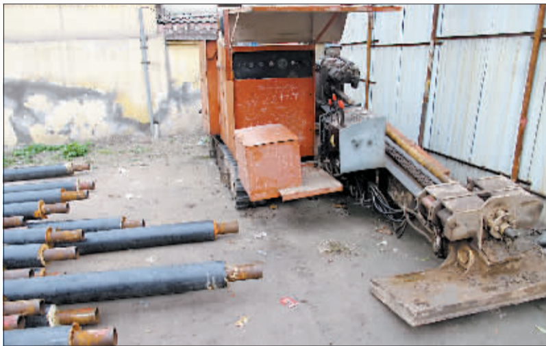
荣祥花园小区供暖施工使用的设备及暖气管道

2日上午,记者来到西工区荣祥花园小区,看到小区外的地面已被挖开,数十根暖气管堆在一旁。