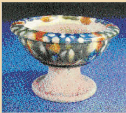
1953年龙门香山寺出土的三彩豆