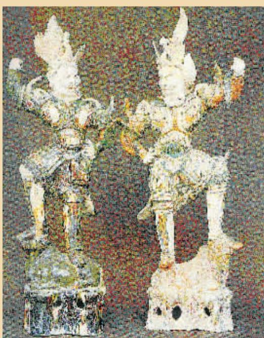
活灵活现的一对天王俑