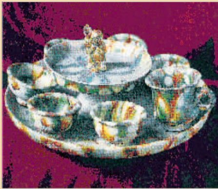
1976年在孟津周寨出土的三彩子母盘。