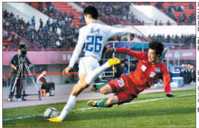
双方队员场上拼抢。