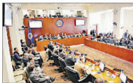
美洲国家组织如无法解决可能提交联合国。