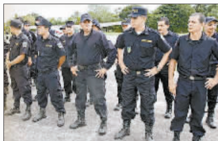
哥斯达黎加增派保安到边境令局势更紧张。