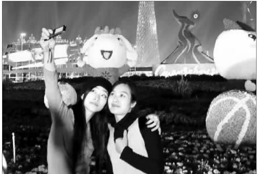
亚运会来了,广州成了欢乐的海洋。无论白天还是夜晚,人们的喜悦都写在脸上。记者 杜武 摄