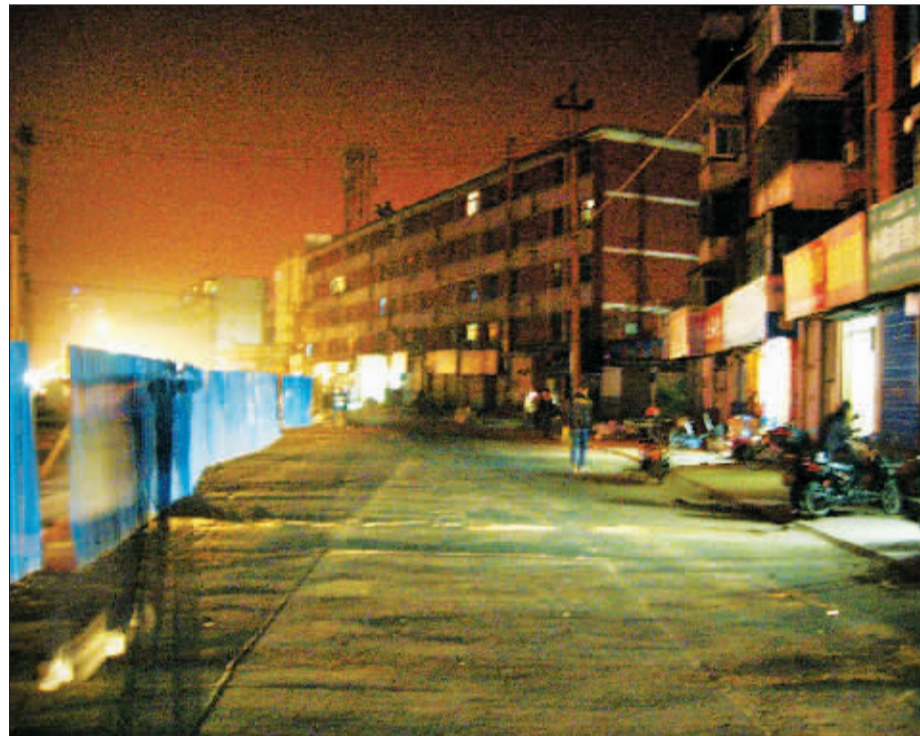
行署路因在进行改扩建工程,路灯暂时拆除。

11月10日晚,我们从市区由东向西,对瀍河回族区、老城区、西工区和涧西区一些次干道的路灯照明情况进行了抽样调查,整体结果令人满意,但也存在部分亟待改善的地方。