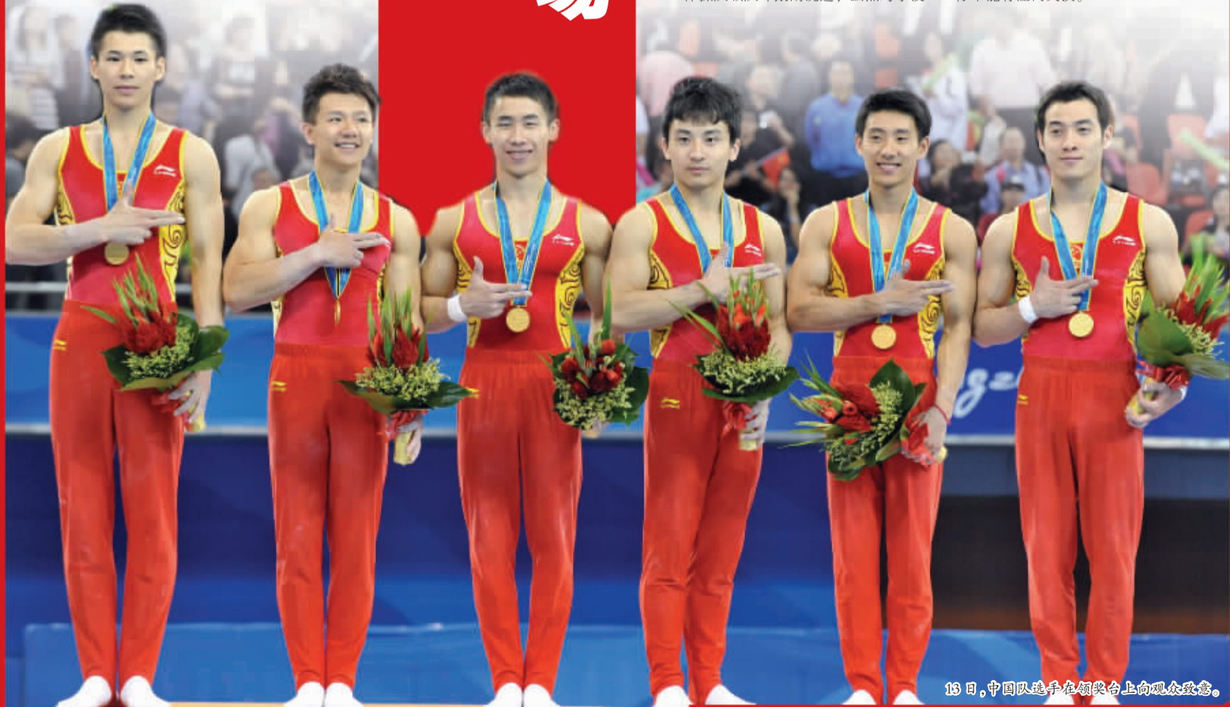
13日,中国队选手在领奖台上向观众致意。

日本男队主教练立花泰则在日本队上午率先结束比赛后预见到了失败,他说:“和中国队这样的对手比赛,你不能有任何失误。”