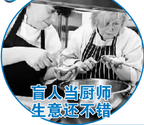
盲人当厨师 生意还不错

英国伯明翰市“概念会议中心”的厨房内,5名厨师各负其责,为顾客准备午饭。你一定想不到,他们都是盲人。