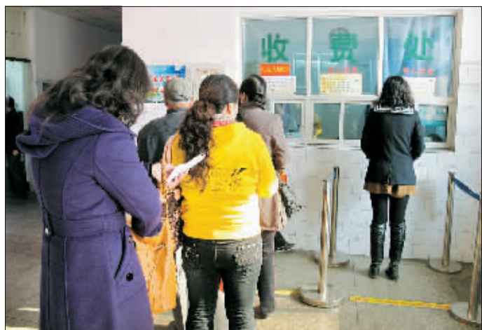
□记者 李岚 通讯员 范海岚 文/图

拨个电话就能提前一周预约专家看病——11月10日,我省118114电话预约挂号服务平台正式启动,涵盖省内69家医疗机构的5119名专家。目前,我市共有7家医疗机构参与,分别是市中心医院、市妇女儿童医疗保健中心、河科大一附院、河科大二附院、河科大三附院、市第一人民医院和市第五人民医院。