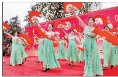
□见习记者 郭立翔/文 记者 张光辉/图

本报讯 昨日,为迎接11月22日我市第四个诚信日,以“打造诚信洛阳”为主题的“诚信进社区”文艺大赛,在周王城广场展开了第二天的角逐(如图),来自全市60多个社区的演员以小品、歌舞、快板等形式诠释自己对诚信的理解,他们当中年纪最大的已年过七旬,最小的只有5岁。