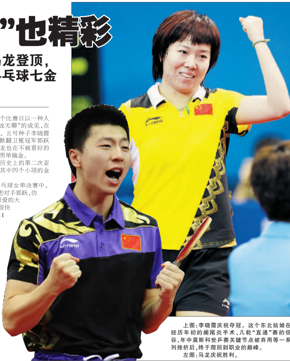
上图:李晓霞庆祝夺冠。这个东北姑娘在经历年初的阑尾炎手术、几轮“直通”赛的低谷、年中莫斯科世乒赛关键节点被弃用等一系列挫折后，终于爬回到职业的巅峰。 左图:马龙庆祝胜利。

随后的男单决赛中，被认为是中国男乒新一代领军人物的王皓虽然在对手局分过三时扳回一局，第六局又接连挽救3个赛点，将比分逼至10:10，但他下一个球的果断扣杀只杀得自己扣球出台，随之9:11、11:8、11:7、11:3、4:11、12:10决赛告败。