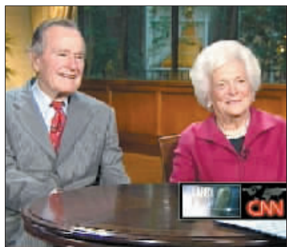
老布什夫妇接受CNN采访。

中国日报供本报特稿 俄罗斯总理普京是个冷血动物,法国前总统希拉克走到哪里都爱说教,德国前总理施罗德说话不靠谱……美国前总统小布什在近日出版的回忆录《抉择时刻》里没少爆料。但出人意料的是,他在评点各国政要的同时,居然还不忘揭自己母亲的短——芭芭拉·布什“曾将自己的死胎储存在一个坛子里”?