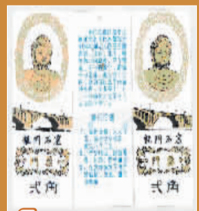
5 面值为2角的塑料书签式龙门石窟门票(竖版佛像图)