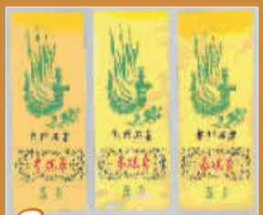
3 1979年使用的黄底深绿三色印刷飞天石窟门票