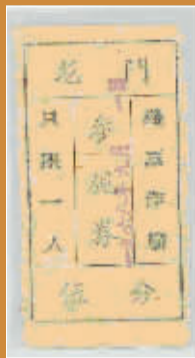
2 九月使用的龙门石窟门票 一九六〇年八月至一九六八年