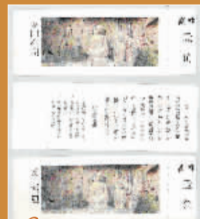
4 最早采用彩色印刷技术印制的龙门石窟门票