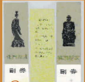
6 纸质的无面值书签式龙门石窟门票