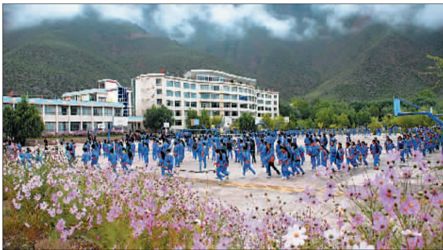
每到夏天,地区二高的操场边就会开满张大人花。

几年过去了,这群来自洛阳的大学生们也都发生了不少变化,男孩子们的皮肤清一色地变成了“古铜色”,一些女孩子的脸也被“染”上了两抹“高原红”,而无一例外的,是他们作出了同样的选择——留下来。因为在他们的灵魂深处,已经有一些共同的东西,留在了这片雪域高原的冻土地里。