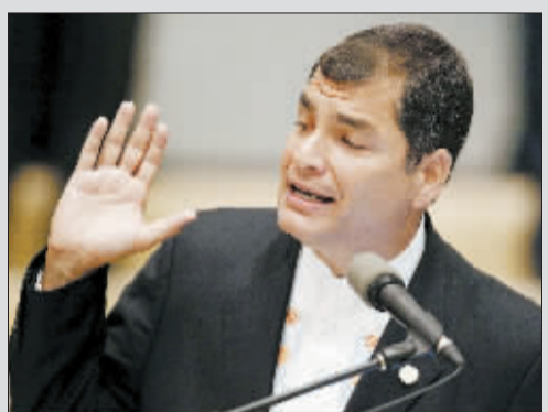
12月1日,厄瓜多尔总统否认将为阿桑奇提供庇护。