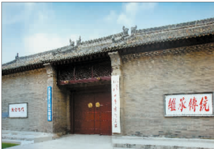
昔日的庄家大院已成今日的洛八办。