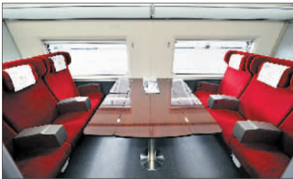
新一代高速动车组一等座包间。