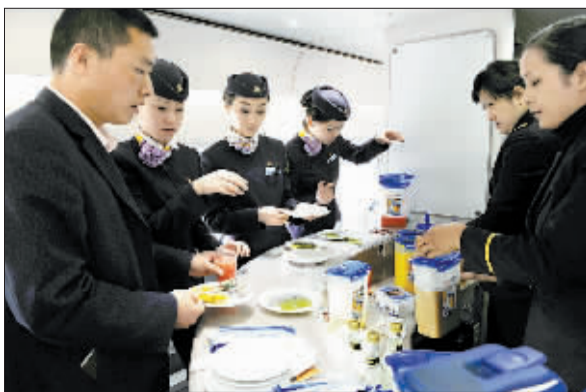
列车员在“和谐号”动车组餐车配餐。