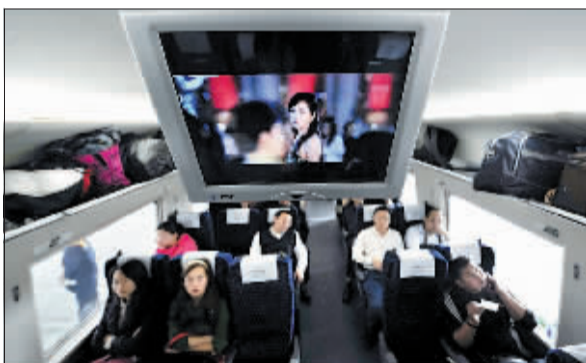
新一代高速动车组二等座车厢。