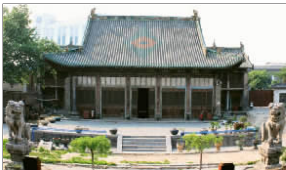
拜殿。其内梁架上的彩绘堪称一绝。