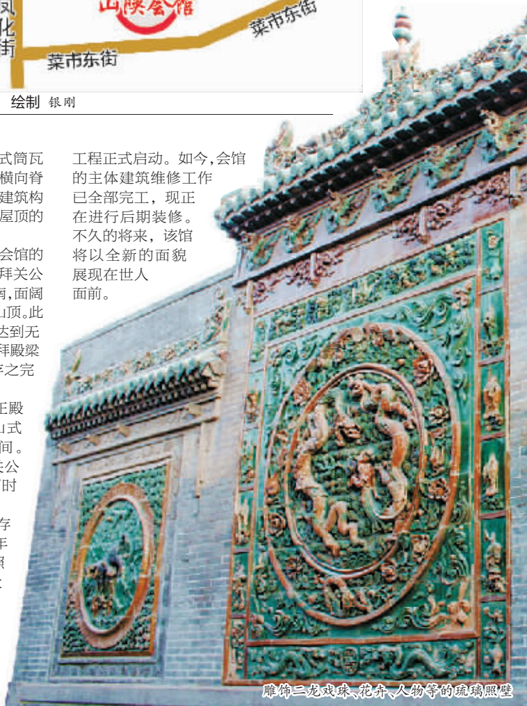
雕饰二龙戏珠、花卉、人物等的琉璃照壁

工程正式启动。如今,会馆的主体建筑维修工作已全部完工,现正在进行后期装修。不久的将来,该馆将以全新的面貌展现在世人面前。