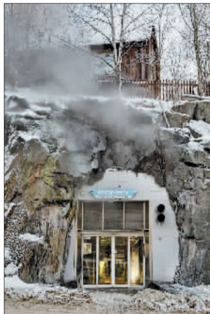
皮奥尼地下数据中心入口处。

阿桑奇曾表示，之所以选择瑞典公司作为“维基揭秘”的主机服务提供商是因为瑞典保障言论自由的法律最为完善，“维基揭秘”不会因为公开机密信息而被瑞典司法机关起诉，为该网站提供信息来源的个人也不会因此惹官司。