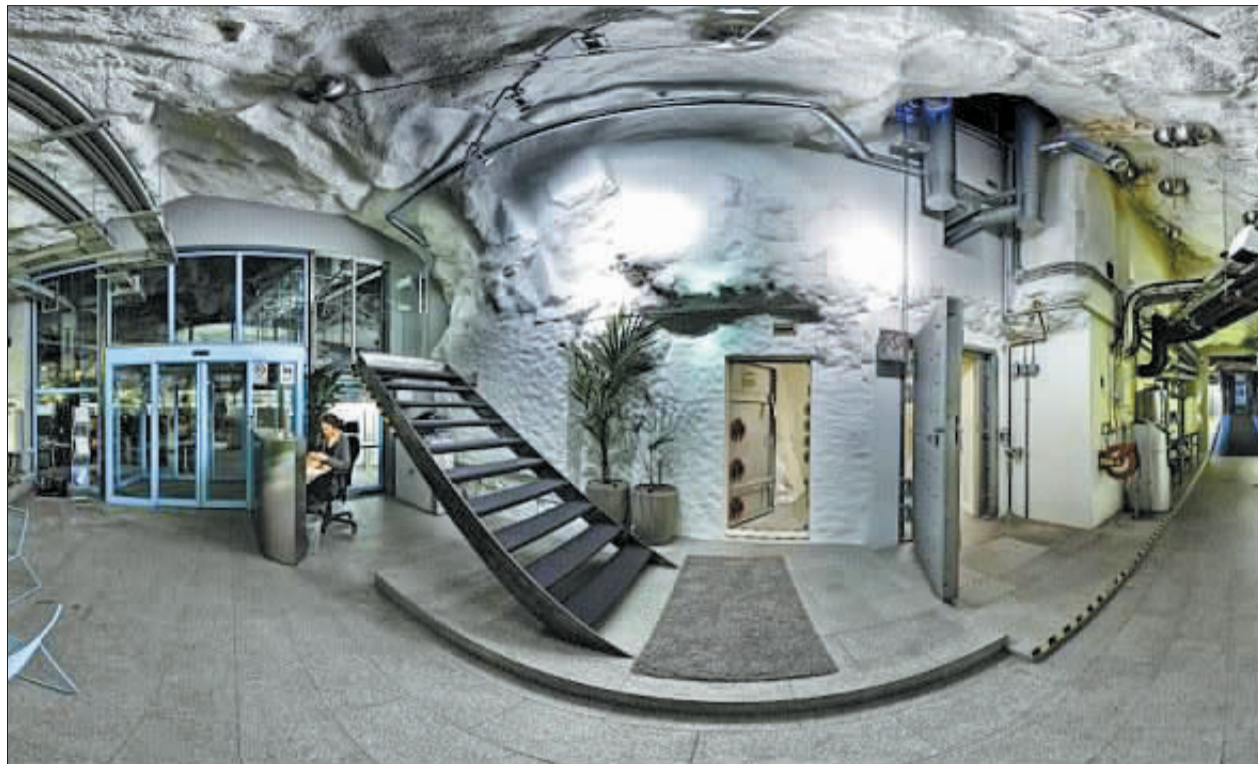
数据中心的宽敞办公环境。