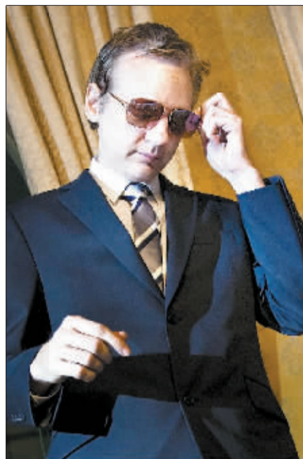
“维基揭秘”网站创始人阿桑奇。