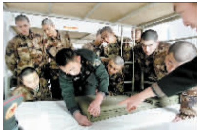
跟班长学叠“豆腐块”。