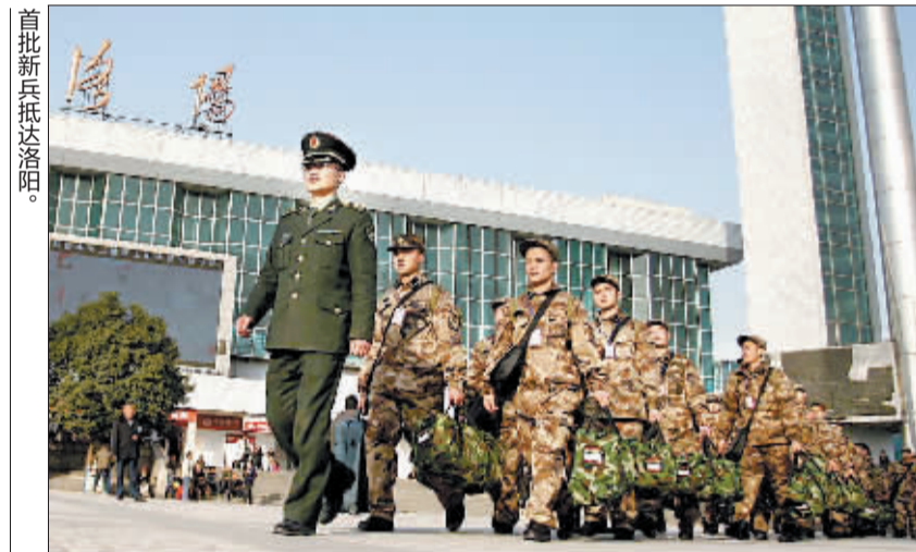
首批新兵抵达洛阳。