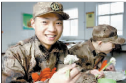
到连队的第一顿饭是饺子。