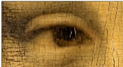
显微镜下发现迷你字母和数字。