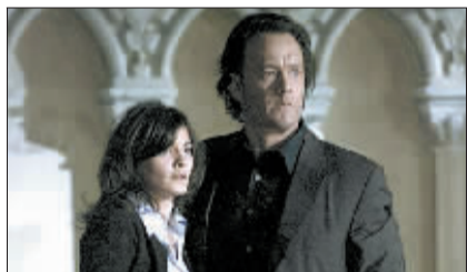
《达芬奇密码》电影剧照。