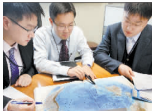
13日,韩国外交通商部内,工作人员讨论救援对策。

按照他的说法,新西兰可以派飞机救援,但飞赴事发海域至少需8小时。亨德森说,事发海域当天浪高1米,风力不大。