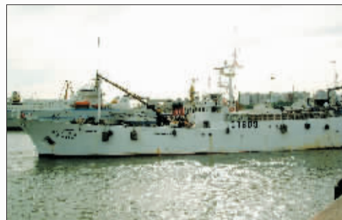
在南极海域作业时沉没的韩国远洋渔船的资料照片。

中国驻韩国大使馆官员13日向新华社记者证实,8名中国籍船员中有4人获救,4人失踪。