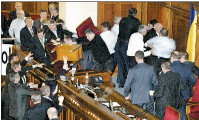
乌克兰议会执政党与反对党议员大打出手。(据中国日报网)

季莫申科 2005 年和 2007 年两度出任总理。今年 2 月在总统选举中,她败给维克多·亚努科维奇,3 月辞去总理职务。