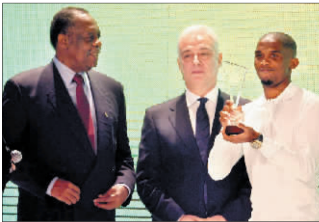
埃托奥（右一）捧起“非洲足球先生”奖杯。

无可争议地成为非洲年度最佳俱乐部。作为南非世界杯上唯一一支闯入八强的非洲球队，加纳队获得年度最佳球队奖。9月份离职