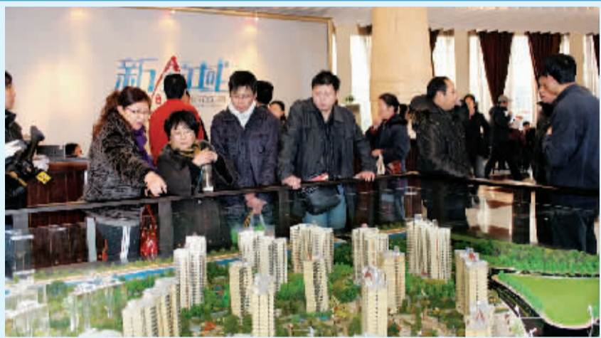
18日,中泰世纪花城5期·新领域VIP会员排号活动正式启动,数百位客户顺利申请到了VIP卡。中泰地产此次主推的90平方米全功能三房,户型设计科学,功能完善,整体配套全新升级,得到大多数消费者的认可,成为我市住宅消费的新趋势。目前,中泰世纪花城5期·新领域VIP会员排号卡正在持续办理中。图为活动现场。