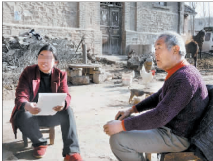
夫妻两人已经相伴10年了。