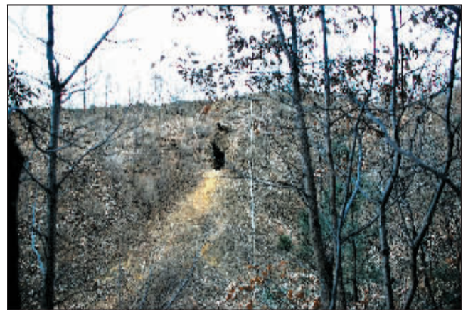
蝙蝠洞地势较高,四面环山,附近林木茂盛。