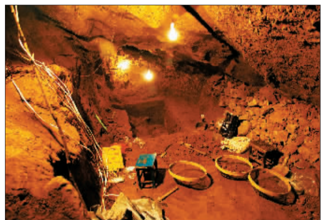
蝙蝠洞考古试掘现场。