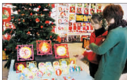
琳琅满目的三彩作品吸引了不少顾客的眼球。

在老城丽景门附近的三彩艺术馆内，我们看到了这批圣诞系列作品和“如意兔”系列作品，它们身上都有不少中国元素，充满着节日的喜庆、祥和。