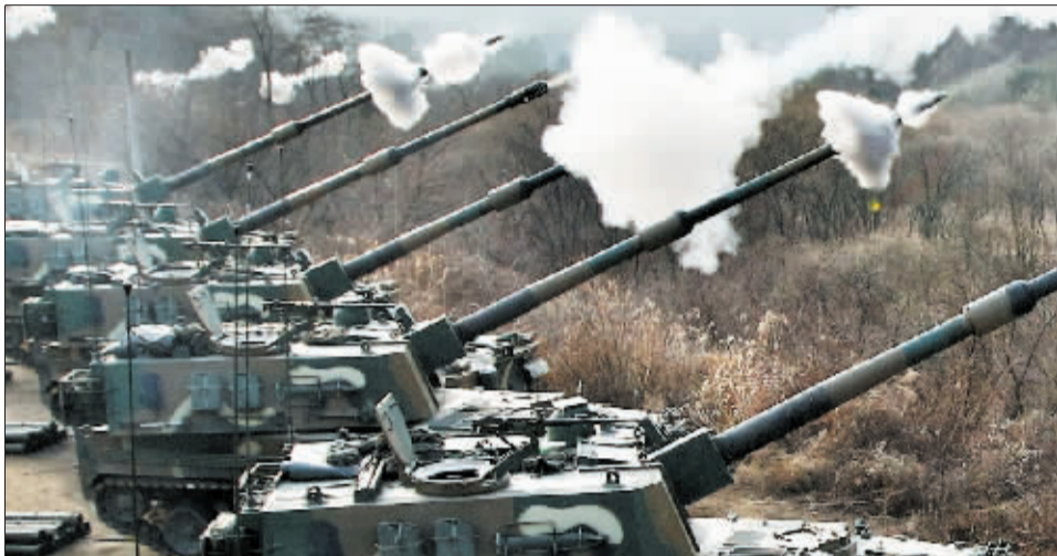
在韩国抱川,文-6 自行炮在演习中。

韩国媒体在评论此次火力演习时说,从 22 日开始的东部海域舰船演习,到 23 日的大规模火力演习,说明朝鲜半岛局势仍然处于紧张状态。媒体认为,此次冬季联合火力演习的一大特点是,演习不再是防御性的,而是攻击性的。