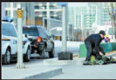
处置完爆炸装置后,一名警察整理装备。