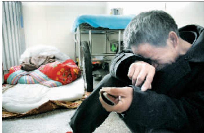
面对医院的催缴单，孩子父亲只能躲在角落哭泣，身后是他的地铺。