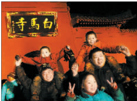
欢喜的人们。

元旦期间,白马寺还将在释源美术馆举行书画展,门票实行半价优惠政策,即在1月1日、2日、3日,所有到白马寺参观的游客,可享受半价优惠(每人25元)。