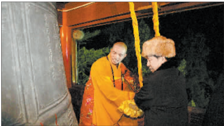
撞响新年钟声。