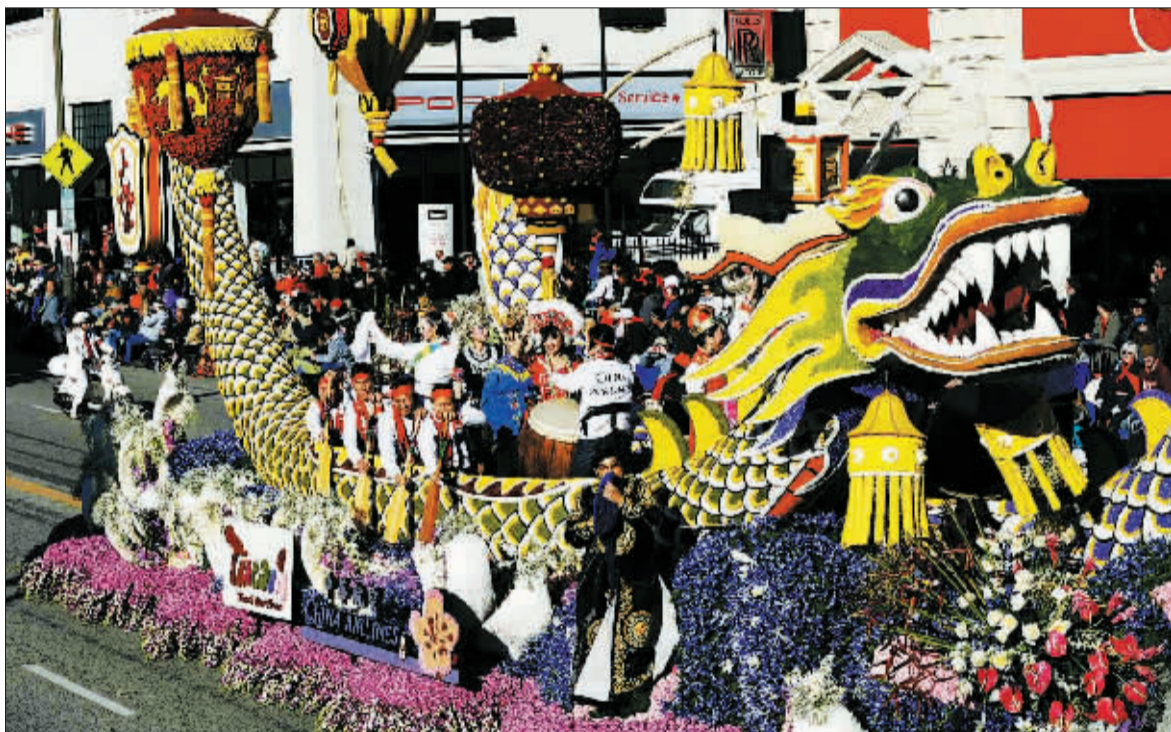
世界各地喜迎新年 1月1日,在美国加利福尼亚州帕萨迪纳市,中式风格花车参加第122届美国新年玫瑰花车游行。(新华社发)

1月3日,在日本横滨一家水族馆,一只海狮在白纸上书写汉字“卯”。按照农历,2011年2月3日~2012年1月22日是辛卯兔年,亚洲很多国家都有过农历新年的风俗。(新华社发)