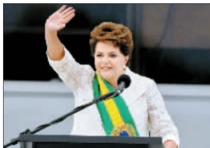
巴西首位女总统就职

1月3日,韩国总统李明博在首尔发表“新年特别演说”。当日,韩国总统李明博发表“新年特别演说”时说,韩国与朝鲜的对话窗口依然敞开。朝鲜《劳动新闻》、《朝鲜人民军》和《青年前卫》三家报纸1日联合发表元旦社论表示,朝鲜维护东北亚地区和平及实现整个朝鲜半岛无核化的立场和意志“不变”。