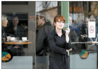
西班牙颁布严厉禁烟法

1月1日,在巴西首都巴西利亚,巴西新总统迪尔玛·罗塞夫在发表演讲时挥手致意。当天下午,巴西新一届总统就职典礼在巴西利亚举行,在2010年的总统选举第二轮投票中获胜的劳工党候选人迪尔玛·罗塞夫正式宣誓就职,成为巴西历史上首位女总统。