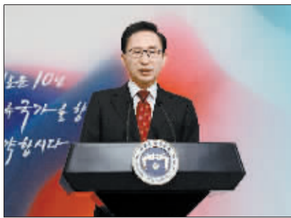
李明博:与朝对话窗口依然敞开

1月3日,韩国总统李明博在首尔发表“新年特别演说”。当日,韩国总统李明博发表“新年特别演说”时说,韩国与朝鲜的对话窗口依然敞开。朝鲜《劳动新闻》、《朝鲜人民军》和《青年前卫》三家报纸1日联合发表元旦社论表示,朝鲜维护东北亚地区和平及实现整个朝鲜半岛无核化的立场和意志“不变”。