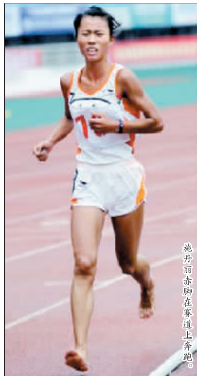
施丹丽赤脚在赛道上奔跑。