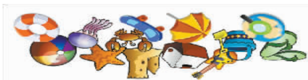
练眼神答案：一共13件，皮球在从左数第12个。

方格填字答案： 横向：1. 小乔 2. 龙虎斗 3. 火花 4. 大溪地 5. 修道院 6. 布鲁诺 7. 倾城之恋 8. 诗经 9. 人猿泰山 10. 艾未未 11. 间丘露微 12. 满江红 13. 孔丘 14. 沉鱼落雁 纵向：一、欧阳修 二、道德经 三、乔家大院 四、马丘比丘 五、龙与地下城 六、艾薇儿 七、斗地主 八、恋人未满 九、江小鱼 十、火奴鲁鲁 十一、诺丁山 十二、鸿雁