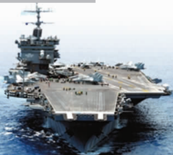
美国“企业”号核动力航母。

视频包括几个片段，霍诺斯在片中使用贬损同性恋词语、与其他出镜军官模仿下流动作、揭开浴帘展示