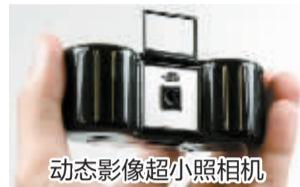
动态影像超小照相机

这款数码LOMO照相机能拍摄出复古效果的动态影像:色调饱和,边缘虚化,图像柔和。